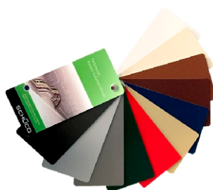
Powłoki Schüco AutomotiveFinish. Unikalna kolorystyka dostępna tylko w technologii Schüco.