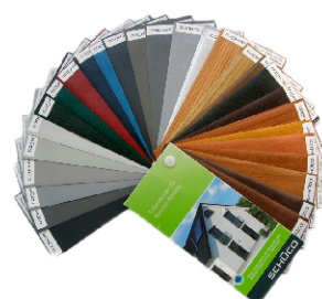
Szeroka paleta oklein imitujących barwy naturalne i wiele gatunków drewna.